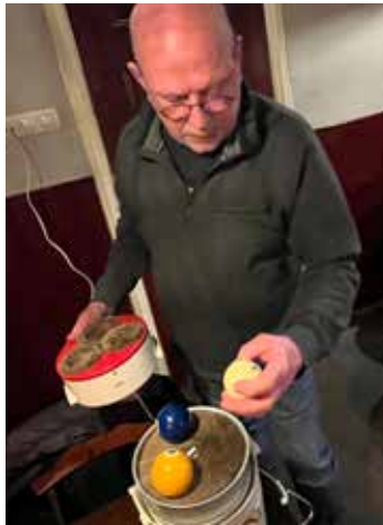
De poetsmaschine fan Pyt

ballenpoetsmaschine. Yn de glânzende faktydkriften hie hy se earder foarby kommen sjoen: 350 euro it stik. Tsjja, dat wie sels foar syn dream wat te bot. Mar doe seach er yn in Ljouwerter fuotbalkantine wrachtsjes in selsmakke eksimplaar stean. Opboud op