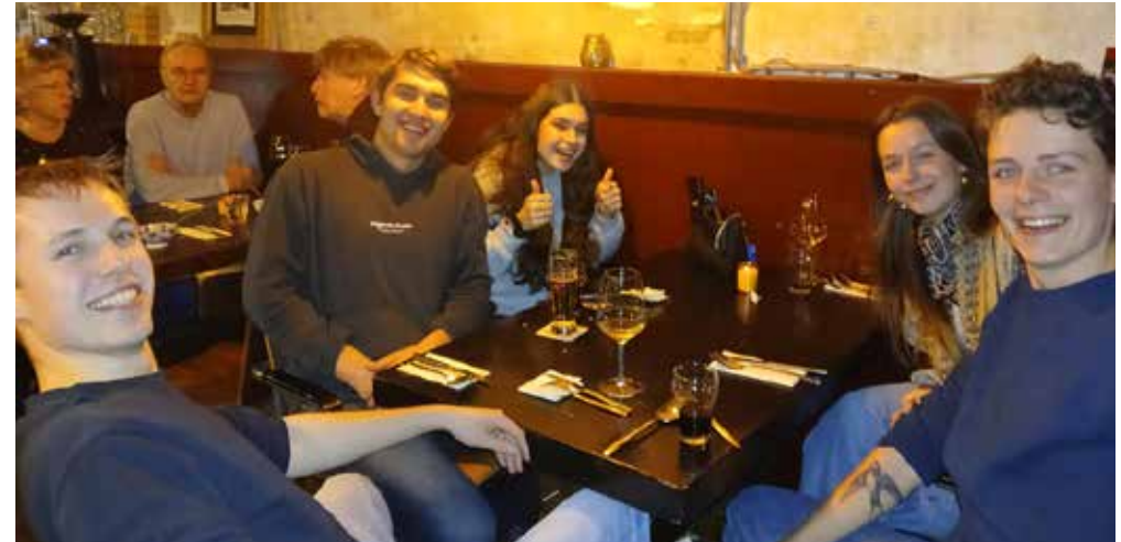
Een proeverij om kennis te maken: al twee keer zat het café bomvol

Waarom de keuze voor Baard? Ze heeft nogal wat omzwervingen gemaakt, vooral voor iemand zo jong. Overal seizoens-