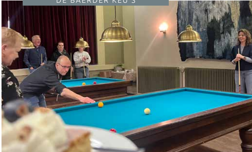
Baarder Keu's On Tour yn Spannum

Mei de poetsmaschine klear foar de takomst