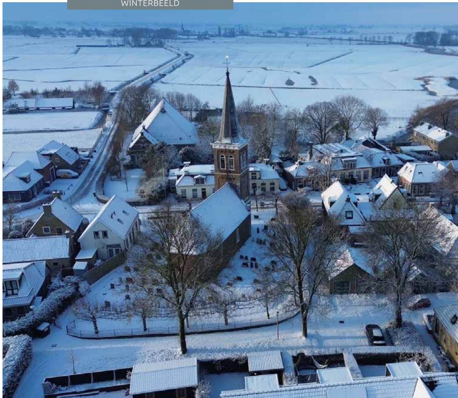
Meer sfeervolle drone-winterbeelden (gemaakt door Kaito Hogerhuis) op dorpbaard.nl