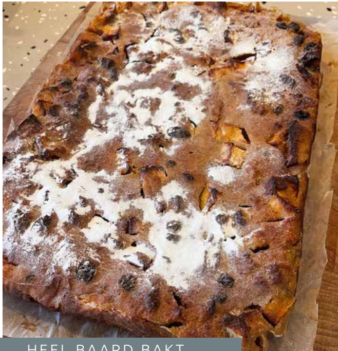
HEEL BAARD BAKT